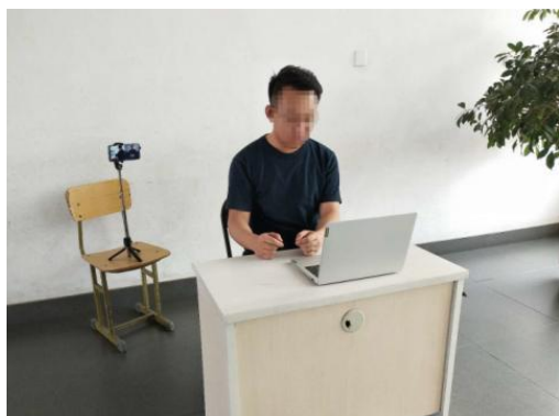
图 1 考生“双机位”设备摆放布置示意图